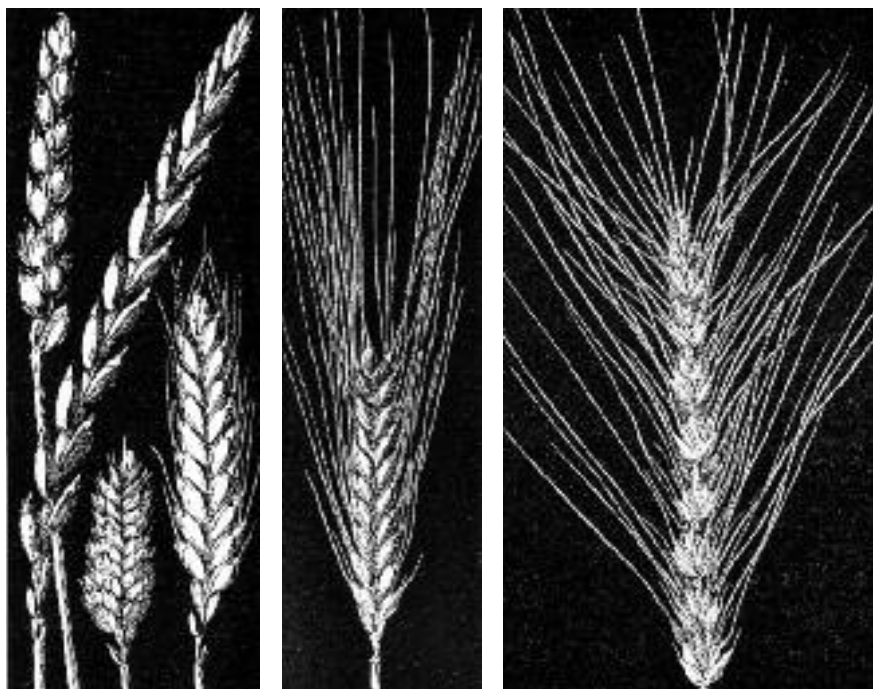
Aus der Systematik des Weizens