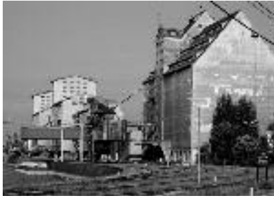
Hafens Albern, Wien