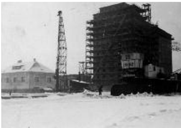
1938/39, Mierka-Getreidesilo im Kremser Donauhafen