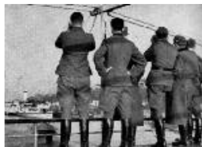
„Umsiedlerkommando“ auf der Donau

Goebbels bezeichnete in seinen Tagebüchern die Zwangsumsiedlung als „großartige moderne Völkerwanderung“ 48 .